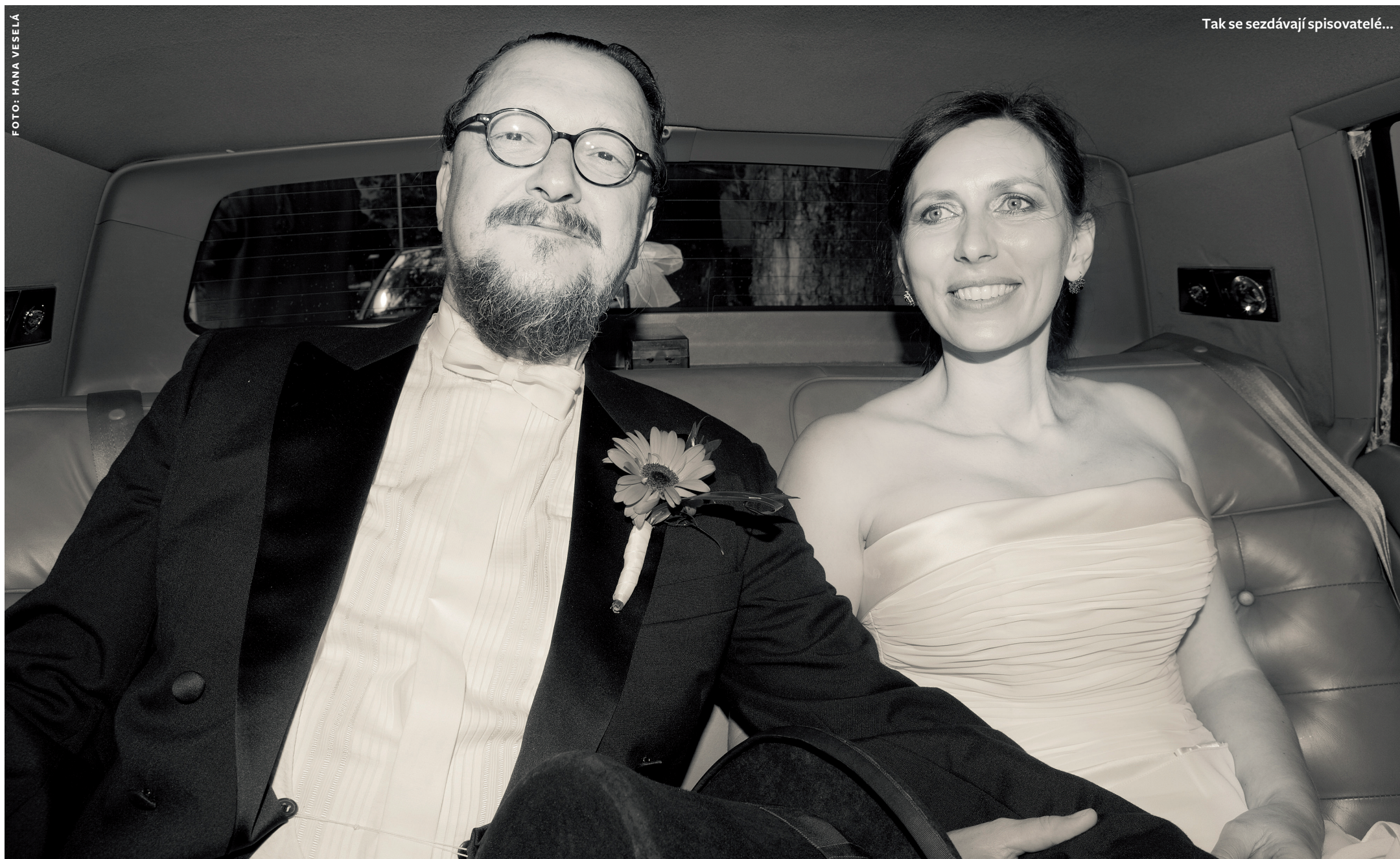
Tak se sezdávají spisovatelé...